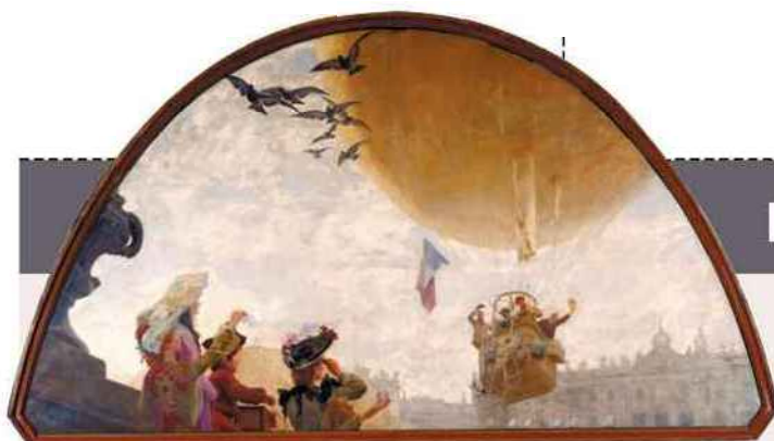
ASCENSION EN BALLON (MUSÉE DES BEAUX-ARTS DE NANCY, DÉPÔT DU MEN)

LA VIE ENCORE... Six expositions dans 6 musées des Vosges (Mirecourt, Epinal, Saint-Dié, Remiremont) www.vosges.fr