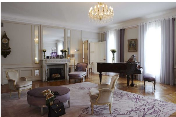
La Suite Marlene Dietrich de l'Hôtel Lancaster Paris